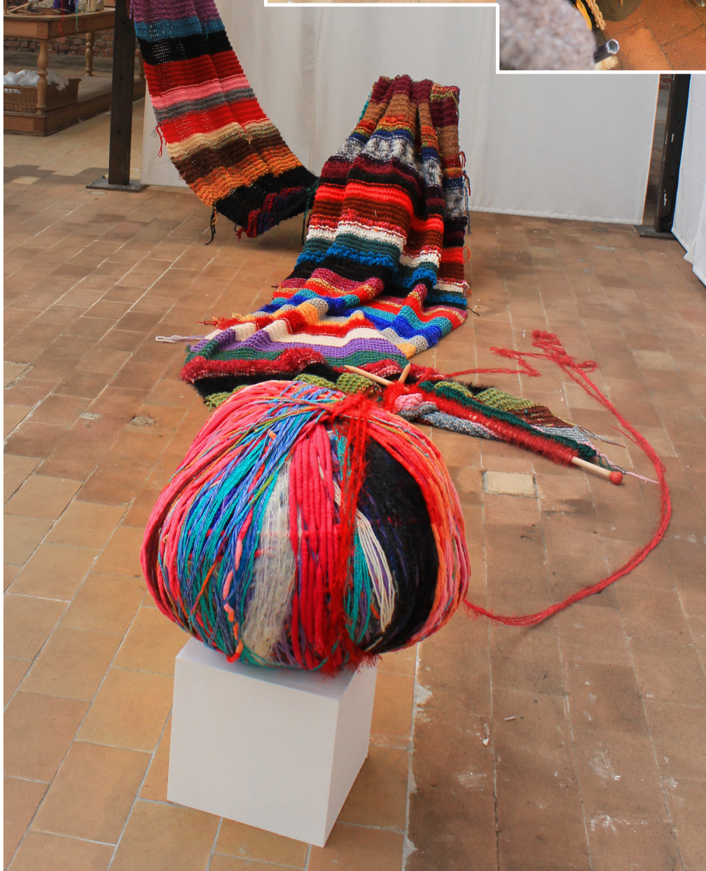
Echarpe Longueur 14 m Largeur 2m Œuvre collective