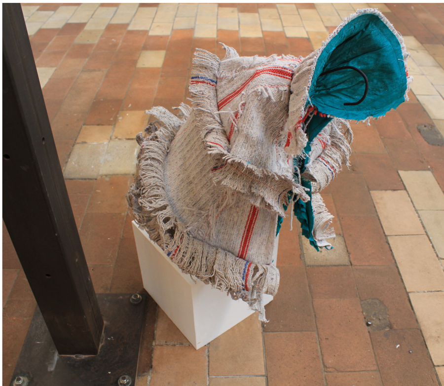
Clodo Serpillère et soie montées sur cintres en acier. Hauteur 40 cm