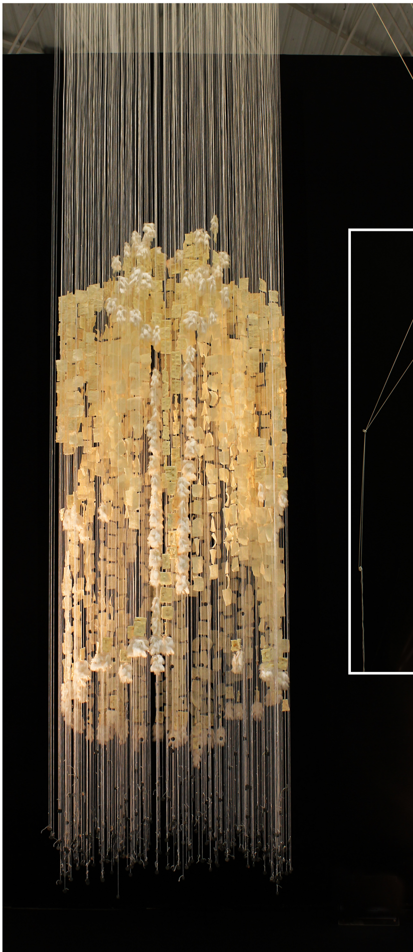
L'envol du Manteau