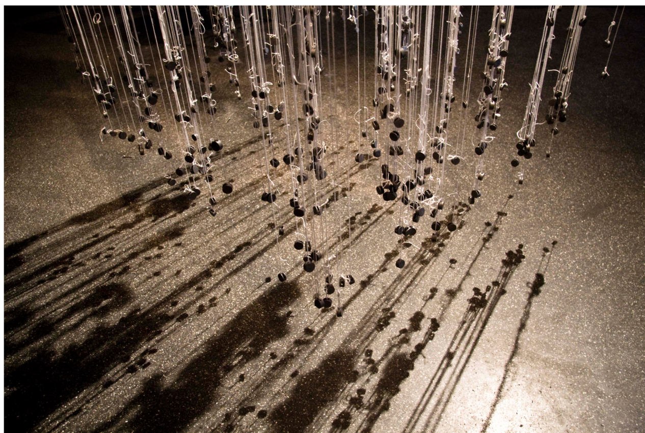
L'Envol du Manteau / Détail