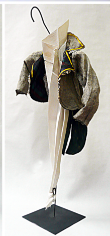
Mon Doudou Tricot monté sur cintres en acier. Hauteur 80 cm