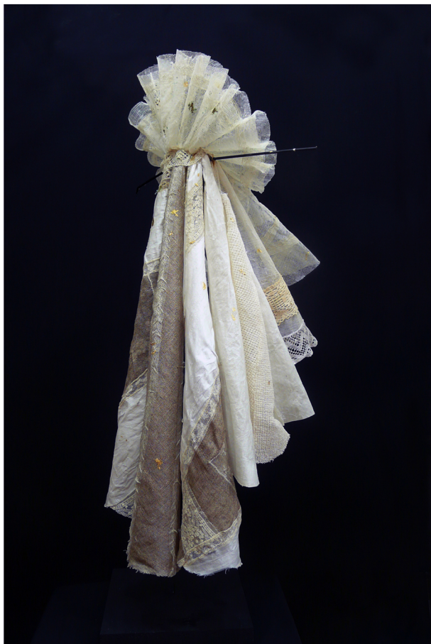
Tuyaux d'orgue Tissus montés sur cintres en acier. Hauteur 80 cm

Les Petits Géants en tenue de soirée sur leur piédestal ne se laissent pas impressionner par les grands manteaux.