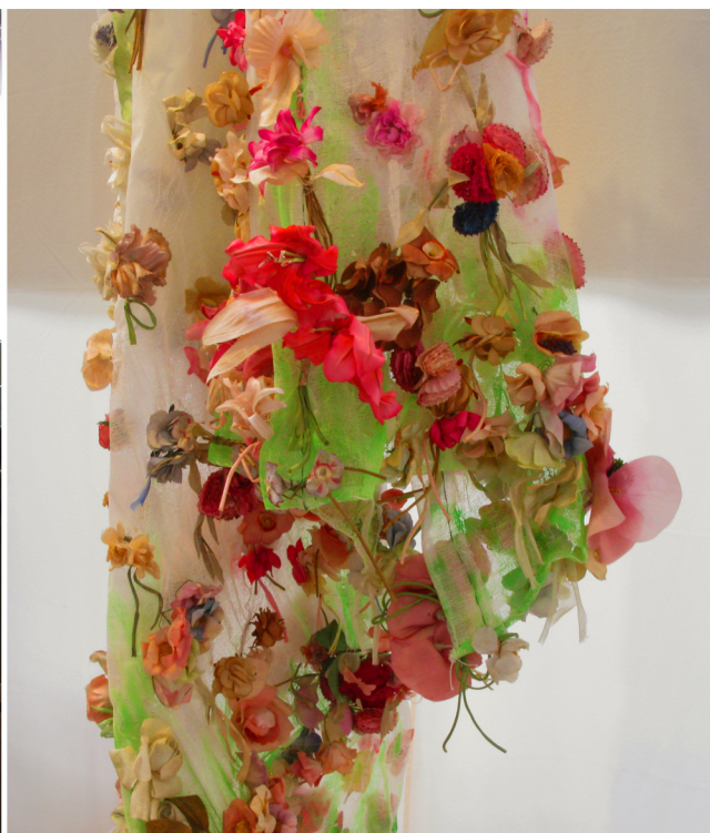
Echappée de penderie Manteau à fleurs grimpantes Tarlatane, fleurs anciennes en tissus et cintre en acier / Hauteur 3m