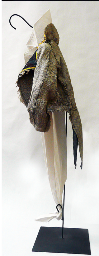
Queue de pie Tissus montés sur cintres en acier. Hauteur 80 cm