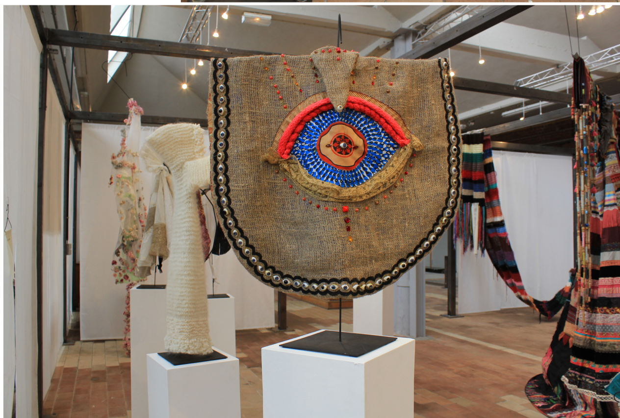
L'œil Toile de jute, tissus et yeux de poupée montés sur cintres en acier Hauteur 80 cm